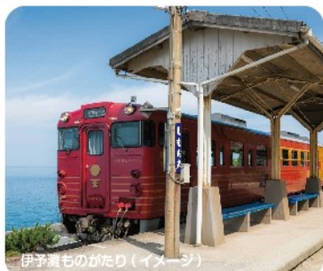
伊予灘ものがたり(イメージ)

1 中村駅 (8:00 発) - 宿毛駅 (8:30 発) - JR松山駅 (13:28 発) + + + (観光列車「伊予灘ものがたり」をゆっくりお楽しみください) + + + JR八幡浜駅 (15:52 着) - 道の駅みなのと - 宿毛駅 (18:30 着) - 中村駅 (19:00 着)