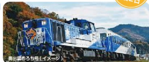
奥出雲おろち号(イメージ)

2 ホテルー道の駅酒造奥出雲交流館 <お土産タイム> - 鬼の舌震 <巨岩・奇岩が続く自然美あふれる大渓谷は、国指定名勝天然記念物> - 出雲三成駅 == 奥出雲おろち号 <全国的にも珍しい「三段式スイッチバック」、日本最大級の二重ループ「奥出雲おろちループ」など見所満載。車内にて弁当> - 世羅高原農場「ダリアとガーデンマーム祭」 <まさに百花繚乱! 7,500株のダリアと、12,000株のガーデンマームの競演> - 宿毛駅 (19:00 着) - 中村駅 (19:30 着)