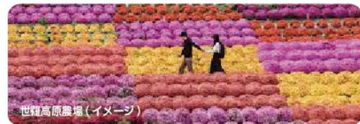
世羅高原農場(イメージ)