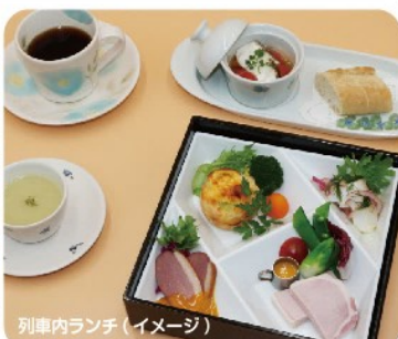
列車内ランチ(イメージ)