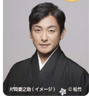
片岡愛之助(イメージ)