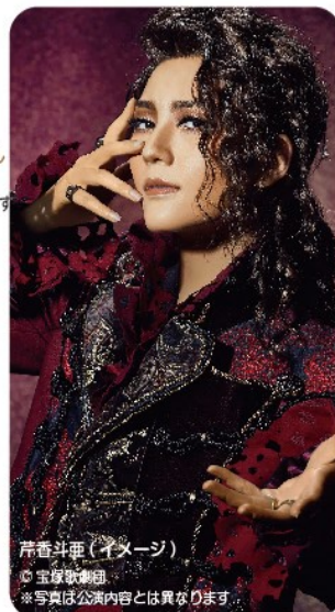
芹香斗亜(イメージ)

1 宿毛駅 (5:30 発) - 中村駅 (6:00 発) - 途中S Aにて各自昼食 - 宝塚大劇場・宙組公演 <夢や希望を胸に、未来へ向かって大空高く羽ばたく新生宙組の姿を、エネルギッシュな歌とダイナミックなダンスで綴るダンシング・ショーをお届け致します> - 中村駅 (22:30 着) - 宿毛駅 (23:00 着)