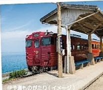
伊予灘ものがたり(イメージ)

【JR四国観光列車「伊予灘ものがたり」乗車の楽しみや流れや色を眺めながら、おいしい料理も味わっていただく山から八幡浜までの約1時間、お夜更八幡浜(八幡浜)からJR松山(松山)山間の夜を安全にお楽しみください。