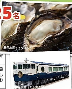
宮島水産(イメージ)