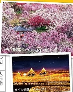
メイン会場(イメージ)