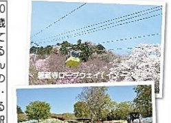
善蔵寺口(イメージ)