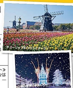
白銀の世界(イメージ)