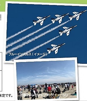
ブルーインパズ(イメージ)