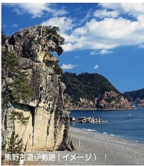
熊野古道伊勢路(イメージ)