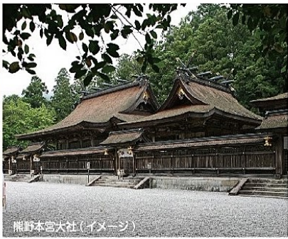
熊野本宮大社(イメージ)