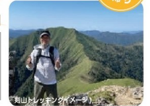
剣山トレッキング(イメージ)