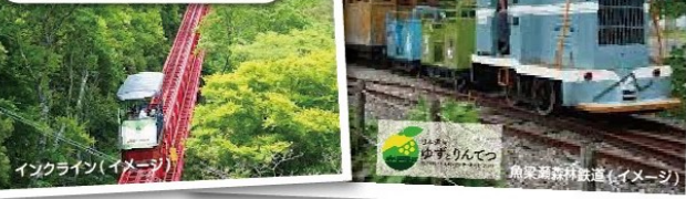
インクライン(イメージ)

【ココソコ話】どしたち現地の方が、「来たことないろし、日本遺産がココにあるって知らんろ!」絶対に喜ぶよ、「こんなところがあるがやね〜! 言うて帰らさきよ!」って、あまりにも言うので、その想いに根負け(笑)して作ったがよね。気になるね〜、当日は「その人」が案内人ですよ(笑)