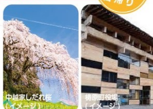
中越家しだれ桜(イメージ)