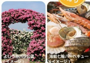
よしうみバラ公園(イメージ)