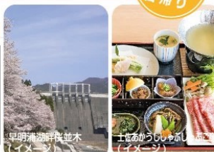
早明浦湖桜並木(イメージ)