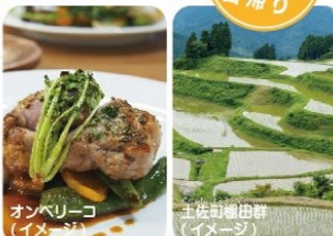
おバレーコート(イメージ)