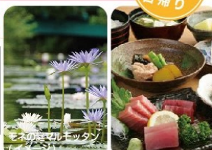
モネの庭マルモッタツ(イメージ)